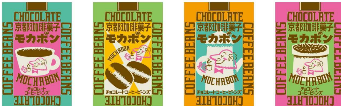
写真：「京都珈琲菓子 モカボン」パッケージ

【本件に関する報道関係者からのお問合せ先】 株式会社シュクレイ 企画開発部 宛 メールアドレス： info@sucrey.co.jp 電話番号：0120-39-8507